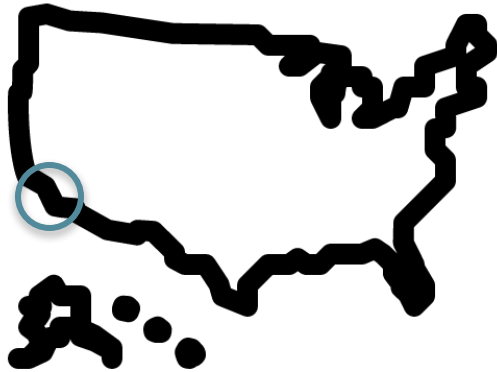
Los Gatos, Silicon Valley